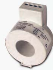
Transformador de corriente MC1-20

El uso de transformadores eficientes, con valor de secundario de 250 mA en lugar de los habituales 5 A, para la lectura de la intensidad de corriente por parte del relé de reactiva DIR2, aporta, de manera suplementaria, la ventaja de garantizar que con independencia, tanto de la distancia entre el transformador y el relé DIR2, como de la sección de cable utilizado, la señal de medida de la intensidad llegará con suficiente potencia y precisión al relé de reactiva, al minimizarse de manera muy notable las pérdidas producidas por la impedancia del cable en comparación a las que se producen con un secundario estándar de 5 A.