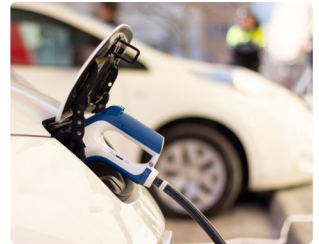
Recharge de véhicules électriques